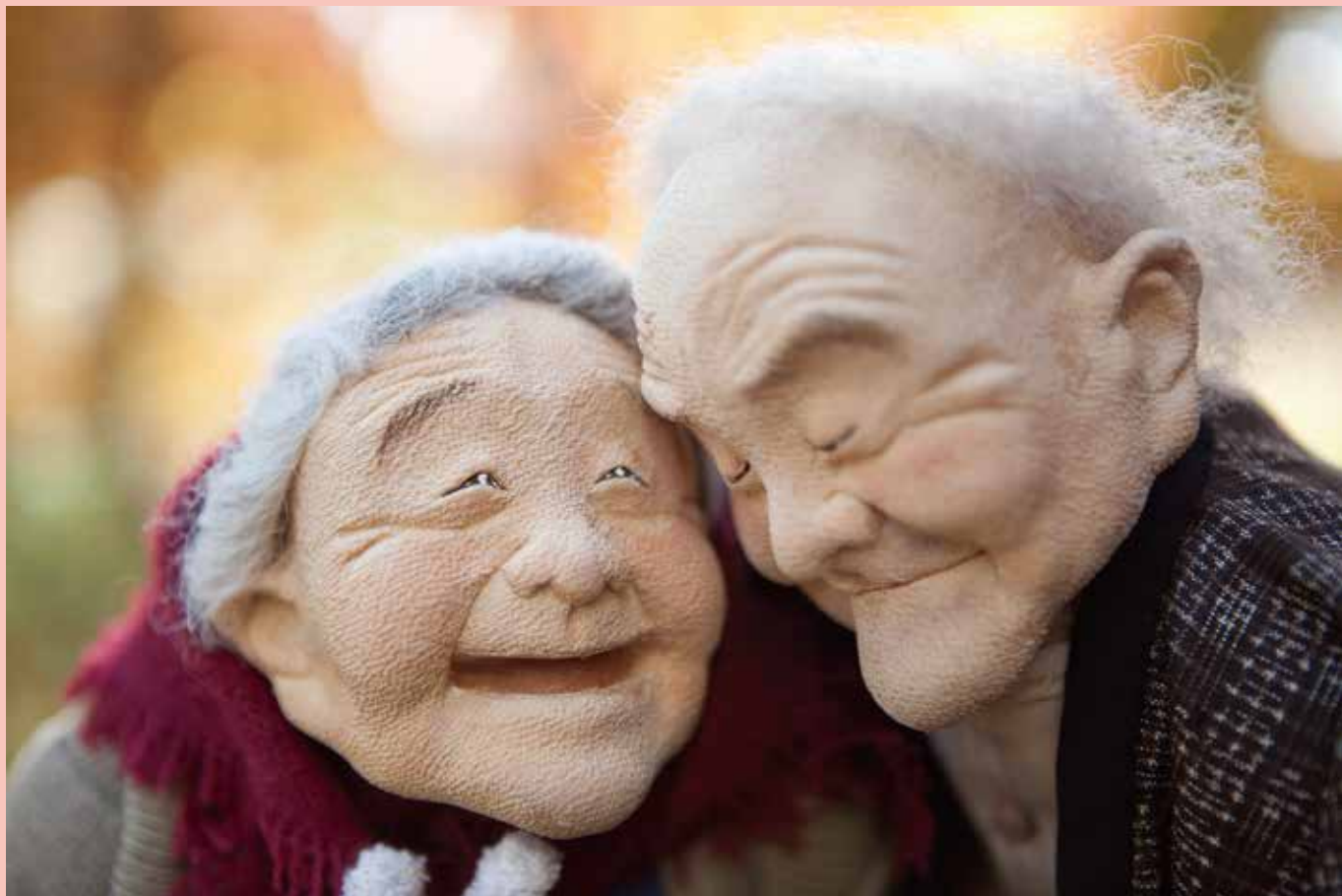
ぬくもり 2003年