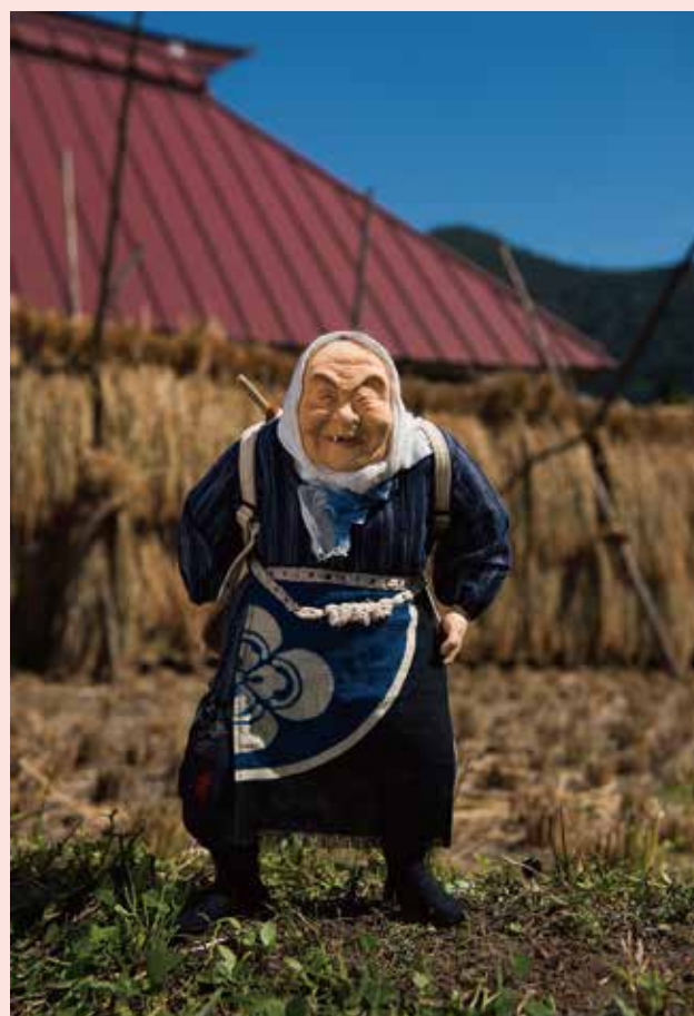
リュックサック 2010年