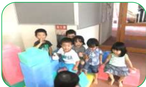
あいらんどでお友達と!