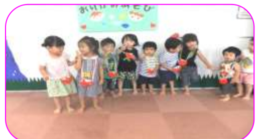
「折り紙遊び」トマトを折ったよ!