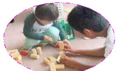
愛知中学生の職場体験がありました

月 … 体操&ちいさなおはなしかい 火 … 体操&親子ふれあいあそび 水 … 体操&絵本のじかん 木 … 体操&うたあそび 金 … 体操&親子ふれあいあそび (ひかりかタイムも週に1回行っています) *センターの行事の都合上、変更あり