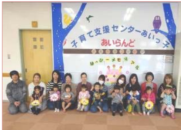
《はっぴーメモリアル》2.3.4歳 3月生まれのお友だちお誕生日おめでとう

「あいらんど」は、平日と 第2・4土曜日10:00~16:30 まで開いています。 都合の良い時間に遊びに来てね。 お待ちしております。