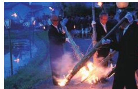
▲準特選「火ふりたいまつ」