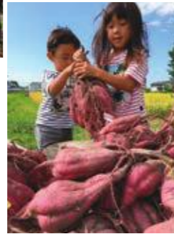
▶優秀賞 「今年も豊作、でっかいぞー！」