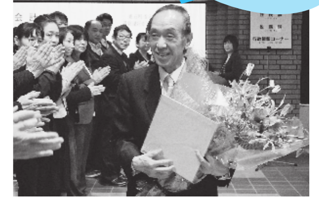
▲職員からおくられた花束と色紙を手に退任する前町長