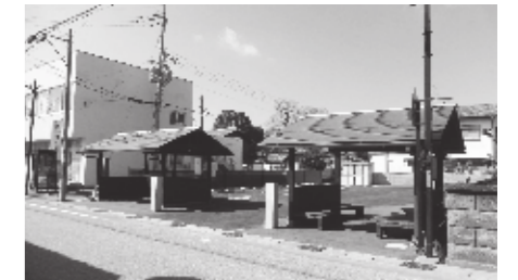
▲ぜひご利用ください