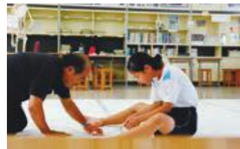
▲優秀賞「ふれあいのしゅんかん」