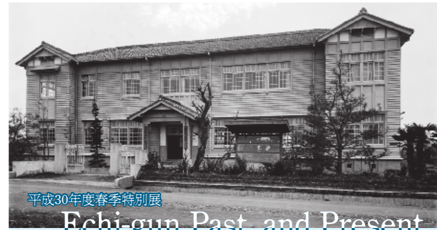
平成30年度春季特別展

☎ ハーティーセンター秦荘 (指定管理者 一般社団法人愛荘町文化協会) ☎37-4110