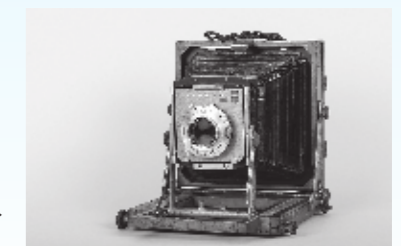
暗箱カメラ(キャビネ)▶ 昭和時代/便利堂蔵

愛荘町には昭和4年(1929)発行『近江愛智郡志』の挿入写真を印刷する際に用いられた写真ガラス原板が約400点伝えられています。これら写真原板には、約90年前の旧愛知郡の名所や旧跡、建造物のほか、現存が確認できない文化財などの画像が記録されており、特に景観や風景などは当時の風土や地域性を知るうえで重要と言えます。