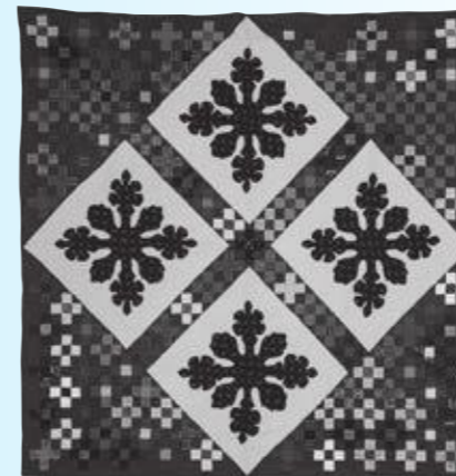
▲パッチワーク壁掛/愛荘町手芸サークル

愛荘町にはさまざまな色や形の布を継ぎ合せて図柄を作り出す「パッチワーク・キルト」をはじめとする手芸の技術が受け継がれています。