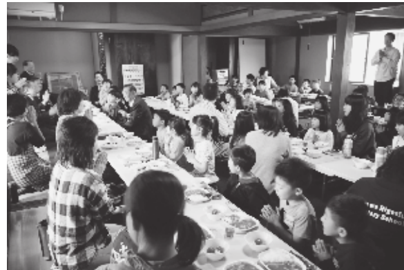
▲元気に「いただきます!」