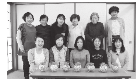
▲完成したびんてまりを並べ、笑顔を見せる参加者