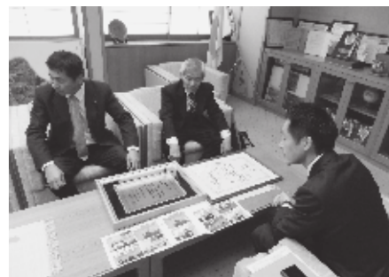
▲有村町長に受賞を報告されました。