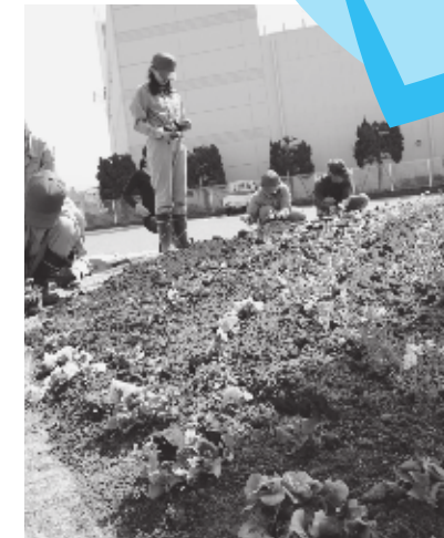
▲真剣な表情で花壇と向き合う生徒たち

東円堂環境美化部の皆さんと協力して、約700株を植えた生徒たちは、「とても疲れたけれど、きれいに仕上がったのでがんばって良かったです。」と、満足そうに微笑みしました。