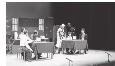
▲平成29年度の第21回公演「ふれあい食堂」