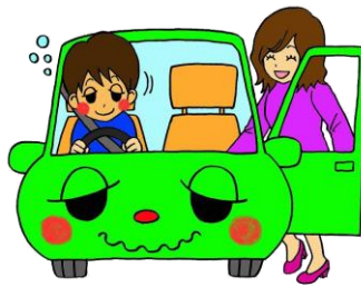
飲酒運転車両 への同乗