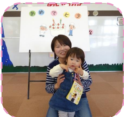
《はっぴーメモリアル》2歳 4月生まれのお友だちお誕生日おめでとう！