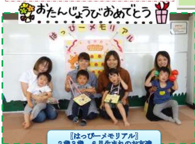
【はっぴーメモリアル】 2歳3歳 6月生まれのお友達

13:00 午後の部 オープン 自由あそび 16:15 お片付 16:30 午後の部 終了 ※あいらんどは、月曜日から金曜日の毎日 と、第2・4土曜日に開館しています。