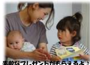
素敵なプレゼントがもらえるよ♪