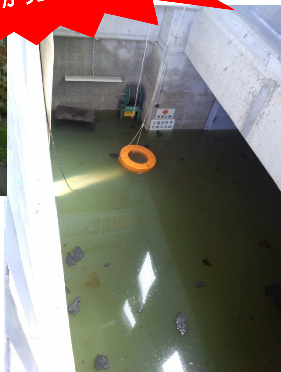
水没したポンプ場

平成25年9月、台風18号の影響で大量の雨水が下水管に流れ込んだため、処理ができず、マンホールから汚水があふれ出ました。