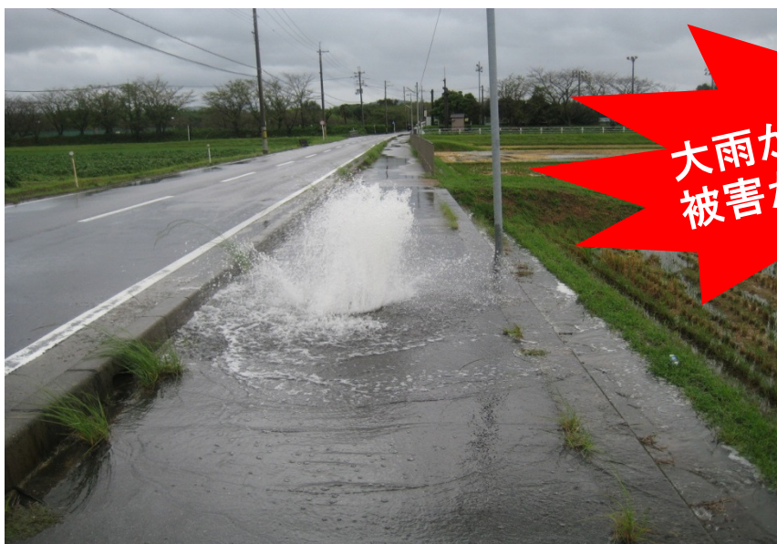
マンホールから汚水があふれ出る様子

雨水を流す雨樋などの排水設備が、誤って「下水管」につながれていることや、排水設備の破損、汚水ますのフタを故意に開けられたこと等が原因です。