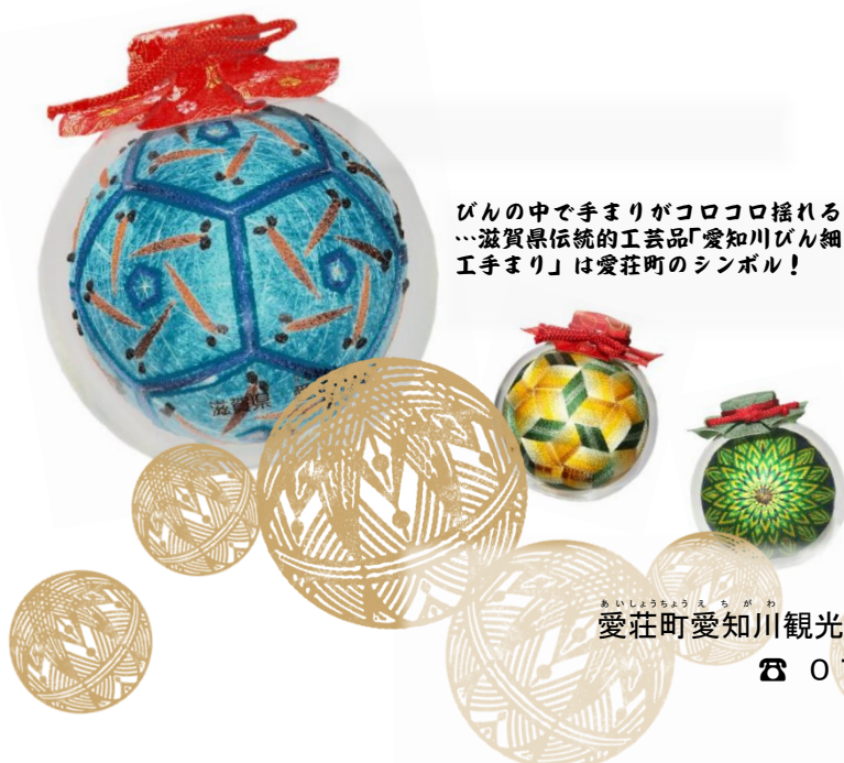
びんの中でてまりがコロコロ揺れる …滋賀県伝統的工芸品「愛知川びん細 工手まり」は愛荘町のシンボル！