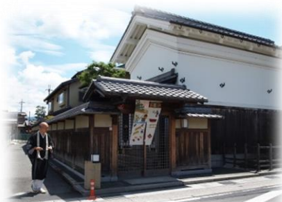
真夏の街道筋に ずらりとのれんを飾ります