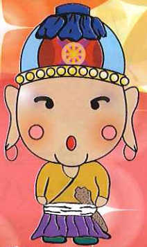
愛荘町イメージキャラクター あしょうさん