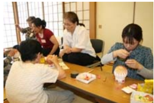
Participantes concentrando firmemente

As participantes por serem novatas estavam tendo dificuldade em concentrar nos trabalhos minuciosos de bordar e fazer o acabamento da bola dentro do vidro. Mas, conseguiram concentrar firmemente até o fim com a orientação das senhoras do Grupo “BINZAIKUTEMARI HOZON-KAI”.