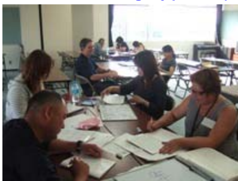
Os alunos estudando firmemente

Dentre os estrangeiros que moram na cidade de Aisho, há muitas pessoas que não estabilizam nas condições de emprego por não falarem bem a língua japonesa. Para que estas pessoas possam desenvolver mais, a cidade abriu o “curso de língua japonesa intensivo” a partir do dia 6 de junho no salão ECHIGAWA KOMINKAN.