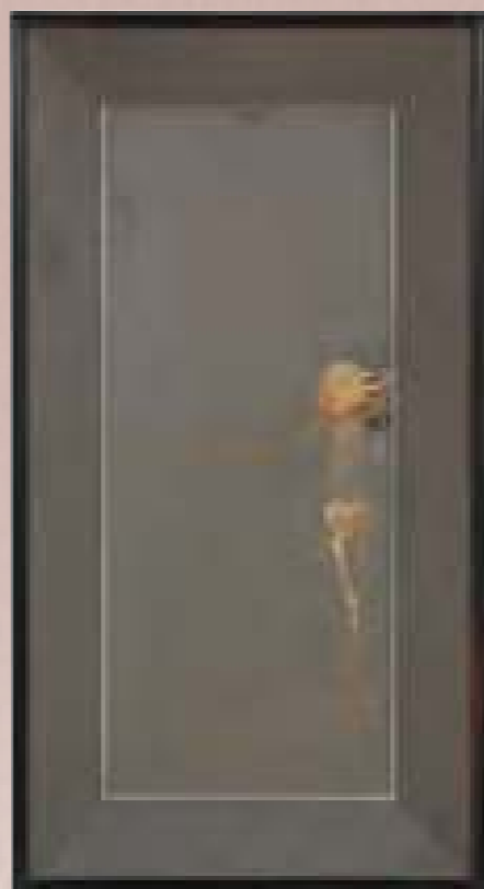
【Ⅱ期】鸚鵡図刺繍画/各 85.0×45.8