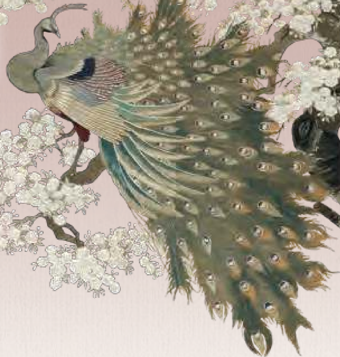
【Ⅱ期】桜花孔雀図刺繍壁掛け