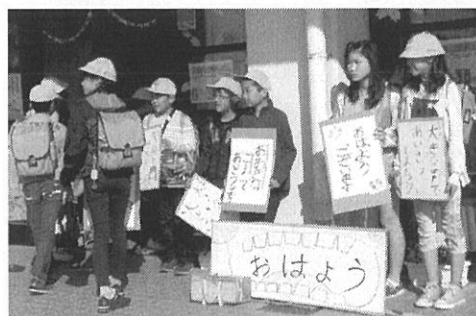
あいさつ運動に取り組む生活委員

5月、6月と温暖な気候になるとともに、例年不審者の情報も増えていきます。学校でも、子どもたちが安全に登下校できるよう、有志の方の協力を得ながら青パトでの巡回パトロールを続けますが、引き続き保護者や地域の皆様の見守り活動をよろしくお願いいたします。