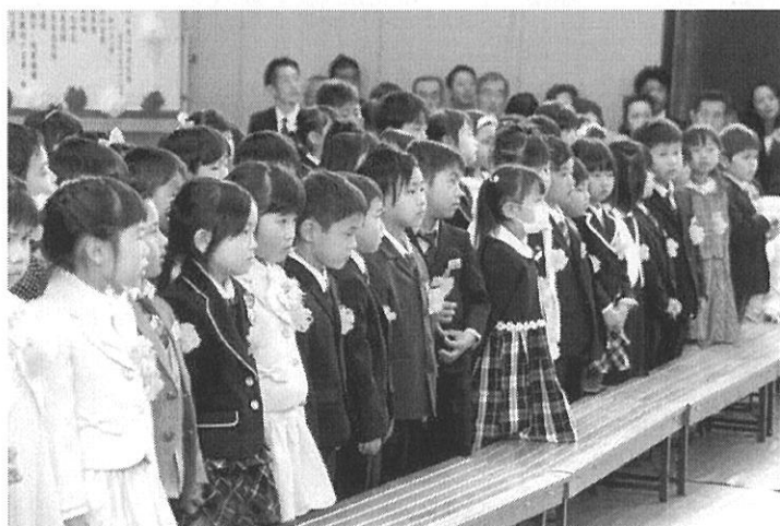
入学式で在校生と対面するドキドキの1年生