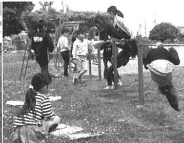
鉄棒検定の技を競い合う