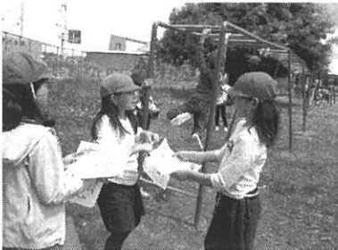
友だちと一緒に遊具検定に挑戦