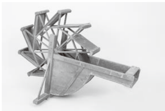
▲ジャブルマ(踏車)/当館蔵

本展覧会では明治期に記された農家の日誌を展示し、今とは異なる昔の農作業を紹介します。また様々な農具とともに、明治期に製作されていた「目加田唐箕」や、愛荘町にゆかりある人物が開発した「坂東式大鋤」などを展示し、農具に見える地域の特色や農業の負担を軽減するための工夫を紹介します。他にも、農作業の様子を描いた「四季耕作図屏風」を展示し、農業の変化を分かりやすく解説します。