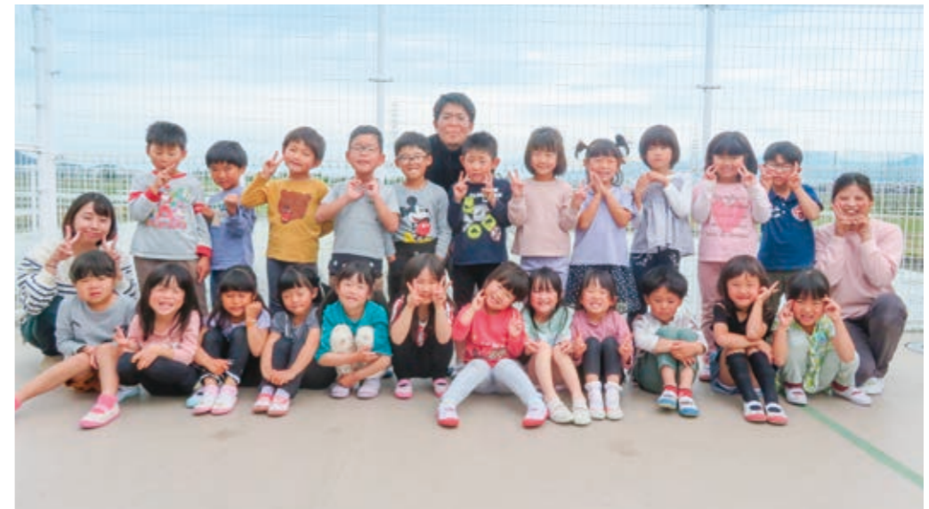
つくし保育園 ひまわりぐみ (5歳児クラス)

元気いっぱい、笑顔いっぱいのひまわり組23名です。山川原の鼓童館へ太鼓の見学に行きました。運動会に向けて、太鼓遊びを楽しんでいます。みんなで暑い夏を乗り越えて楽しい思い出いっぱい作ろうね。