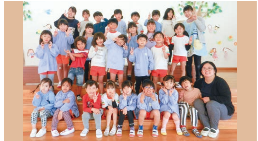
愛知川幼稚園 ひまわりぐみ (5歳児クラス)

戸外遊びが大好きな、元気いっぱい26名のひまわり組です！遊びの中で、「こうしてみよう！」と友達とアイデアを出し合いながら遊んでいます。最後の園生活、楽しい思い出をたくさんつくろうね♪