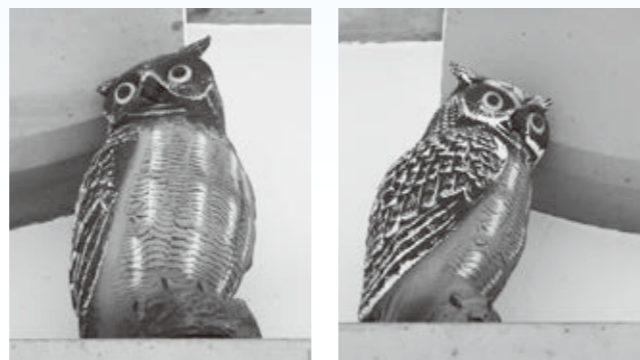
▲木彫りのふくろう①