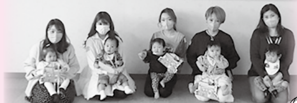
♡5月生まれのきらきらバースディ♡