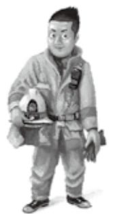
▲「しごとば」 ▲「続々・しごとば」