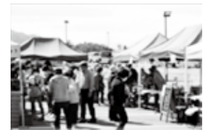
▲毎月第4日曜日に開催「あいしょう朝市」