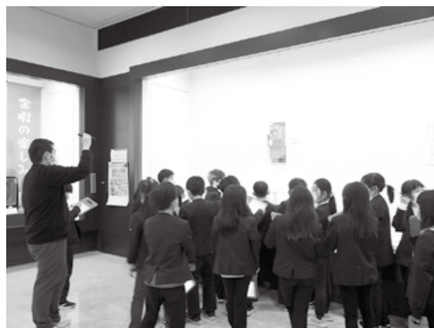
▲生徒への展示説明の様子