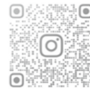
▲愛荘66かまど祭 公式Instagramアカウント