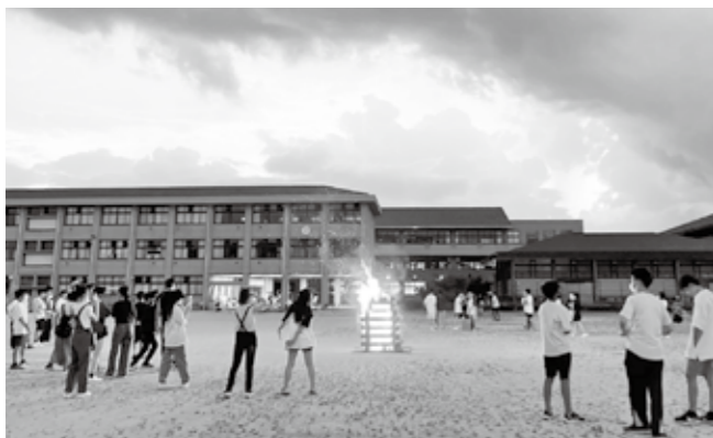
▼キャンプファイヤーを囲む生徒たち

子どもたちは、手まりの原型となる丸い土台づくりから、刺繍、びん入れまで、すべての工程を6日間かけて本格的に学び、最終日には、参加した子どもたち全員がびんてまりを完成させ、「大変だったけど楽しかった」「自分だけのびんてまりができてうれしい」と嬉しそうに話していました。