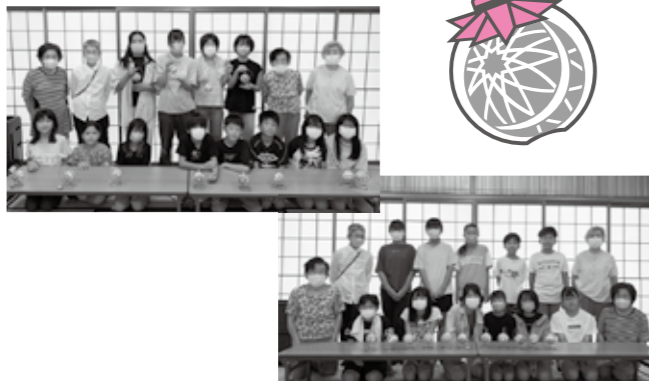
▼びんてまり教室参加の皆さん