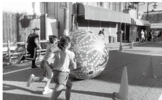
▼びん手まりころがしに挑戦する子どもたち

参加された方は、「想像をふくらませること、遊び心をもつことを学びました」「自由に表現することの楽しさを実感しました」と話されました。