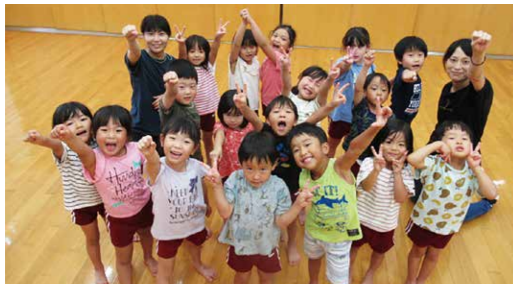
八木荘保育園 らいおんぐみ (5歳児クラス)

男児7名、女児10名、計17名のらいおん組です。作ることを大好き、体を動かすことを大好き、おしゃべり大好き、楽しいことを見つけ、毎日元気いっぱい過ごしています。運動会では、みんなで力を合わせてがんばることができました。残りの園生活も、みんなで元気に楽しく思い出いっぱい作っていききたいと思います。