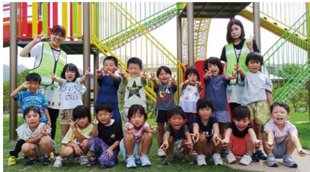
秦川愛児園 うめぐみ (4歳児クラス)

毎日きらきら笑顔の4歳児うめぐみのみんなです。大きな声で歌をうたうのが大好き、元気に走るのが大好きなパワーいっぱい！の16人です。たくさん遊んで楽しく過ごそうね！！