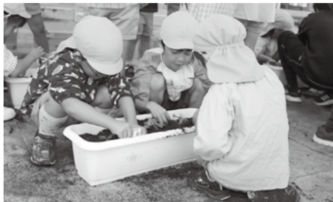
▼プランターにビオラの苗を植える園児たち

また、園児たちは、掘れば掘るほど出てくるさつまいもに大興奮の様子で、「たくさんおいもがとれたよ」「おいも重たい」と嬉しそうに話していました。