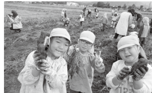
▼収穫したさつまいもを手に喜び園児

子どもたちは、座り込んで車座になり、グループで1冊の本を覗きこんだり、1人でゆっくり読んだりするなど、それぞれ自由なスタイルで「えのほんひろば」の時間を楽しんでいました。