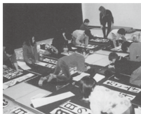
▲当時の書初め展開催風景

歴史文化博物館で書初めを開催します。愛荘町在住の書家の先生をお招きして、実際に指導をしていただきます。冬休みの書初めを博物館で取り組んでみませんか。