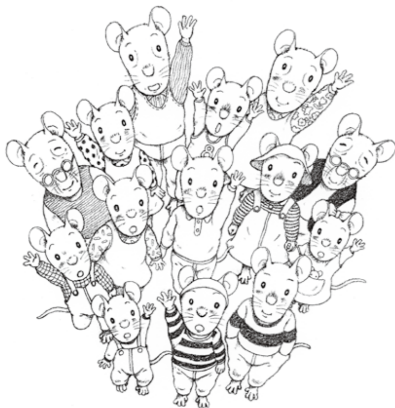
▲「14ひきのシリーズ」より いわむらかずお 絵

栃木県那珂川町(旧馬頭町・小川町)と愛荘町(旧秦荘町・愛知川町)の交流は、国民体育大会のアーチェリー競技が縁となり始まりました。昭和56年に姉妹都市盟約が締結されてからは、議会をはじめ、教育や観光物産の交流が現在も続いています。