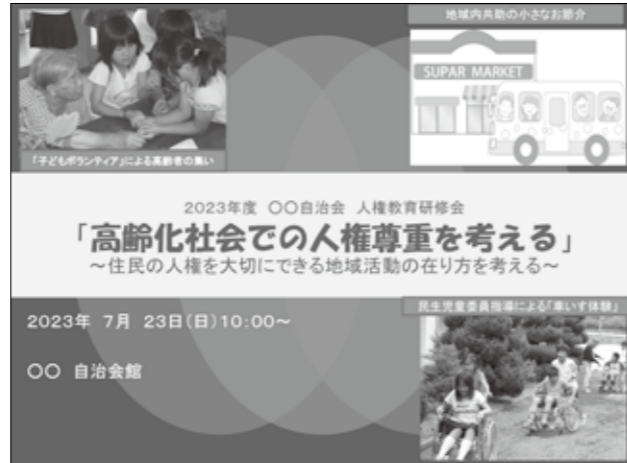
▲自治会研修資料から

こうした課題を踏まえ、地域では「地域づくり委員会」等を設置し、これからの地域のあり方を模索・検討されている地域もありますが、コロナ禍を終えた今だからこそ、これを契機とし、各地域が女性や子どもの参画を踏まえた一人ひとりを大切にできる地域づくりに転換していくことが必要ではないでしょうか。