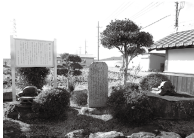
▲畑田廃寺現地看板

畑田廃寺は、愛荘町畑田に所在する飛鳥（白鳳）時代の古代寺院です。北西には廣照寺や天一神社が立地し、北東約700メートル先には勝堂古墳群があります。現地には説明看板が設置されており、その隣には巨石が残されています。