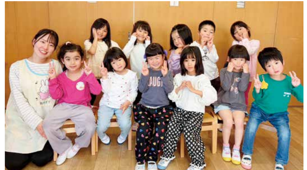
愛知川保育園 そら組 (5歳児クラス)

元気いっぱいいつでもにぎやかなそら組さん!! ボール遊びや鬼ごっこをして体を動かしたり、制作を楽しんだりと毎日元気に遊んでいる子どもたちです。 難しいことにもどんどん挑戦して、これから待っているたくさんの経験をみんなで楽しんでいこうね!