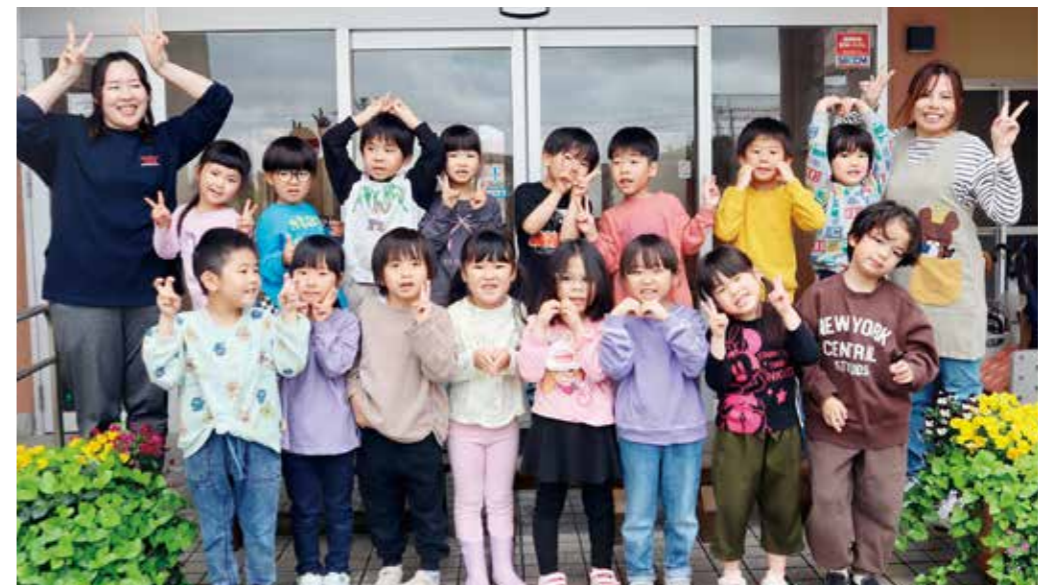
ゆたか保育園 たいよう組 (5歳児クラス)

おしゃべりや歌を歌うことが大好きな子どもたち。 いつもにぎやかなたいよう組です。 新しいお友だちが増え、もっとパワーアップ! いろいろなことに挑戦したいです。