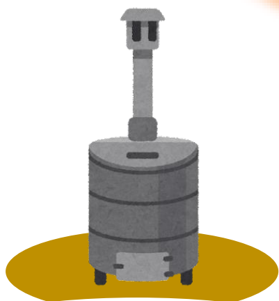
不適合焼却炉での焼却