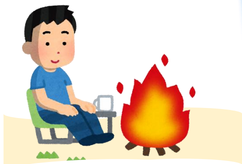
地面や地面に掘った穴での焼却