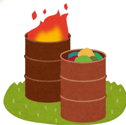
ドラム缶を用いての焼却