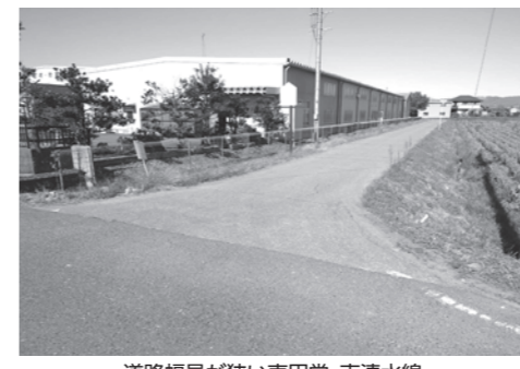
道路幅員が狭い東円堂・南清水線