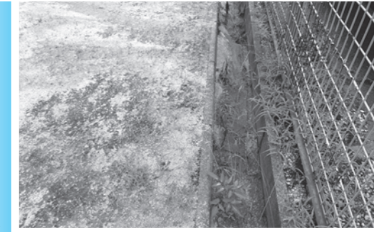
土砂が流出するグラウンド

答 (生涯学習課長) 議員御意見のように、様々な効果があると考え、一方で、芝生化するにあたっては、当初の整備や維持管理に多くの労力と経費が必要となる。学校施設や社会体育施設の整備は、優先事業を判断し、計画的に進めている。他、市町の動向を注視し、情報収集に努める。