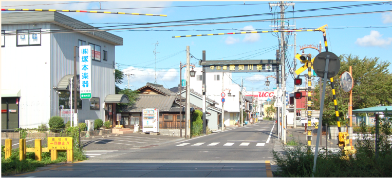
現在の近江鉄道線踏切付近

愛知川図書館 0749 (42) 4114 秦荘図書館 0749 (37) 4345