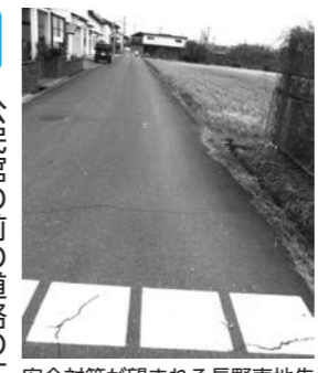
安全対策が望まれる長野県東

問 公民館の前の道路の拡幅を要望する。(川原自治会) 答 (建設・下水道課長) 協議のなかで、町道川原・山川原線が先行し整備されなければ、工事の手戻りや普通河川の取り付けにも影響を及ぼす恐れがあるため、町道川原・御崎神社線は現段階においては整備できないことをお伝えしている。