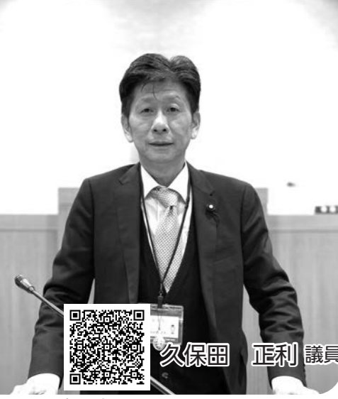
録画配信はこちら