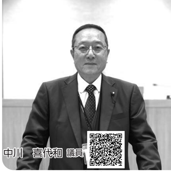
録画配信はこちら

問 必要となる。ガスとの併用利用により、大きなメリットが得られる場合には、ガス機器導入の検討も視野に入れる必要があると考える。しかし、他市町の給食センターにガスを使用していることのメリットを聞き取っても、顕著なメリットがある回答は得られていない。 答 (建設・下水道課長) 現段階においては、ガスは熱源とした高温多湿型厨房ではなく、電気を熱源としたドライシステムが望ましいと考