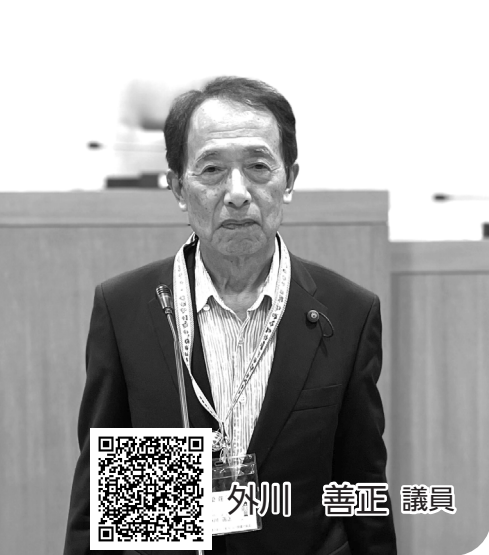
録画配信はこちら