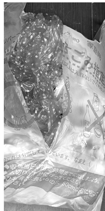
裂けやすい燃やすごみ袋

問 ①町民の方に燃やすごみの袋が裂けやすいと苦情を伺っている中で、もう少し丈夫な材質にすることを