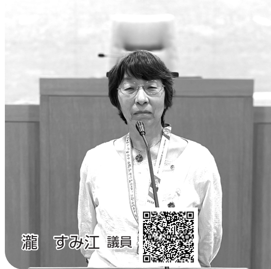
録画配信はこちら