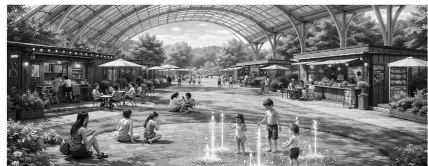
空き地の活用(イメージ)

問 本町では空き地が目立つ地域もあると感じている。景観や防犯、地域活性化の観点から、空き地の活用を町はどのように考えているのか。半屋外の雨をしのげる空間を整備し、店舗やコンテナ型ショップ、カフェ、レストランなどを誘致し家族が一日中過ごせる拠点づくりを目指すことが良いのではないか。町内には飲食店や遊び場が少なく、住民が町外へ流出している。町外から人を呼び込むことで町の活気や交流も生まれると考える。また、拠点が整備されれば、地元の40代以上や子育て世代の方の雇用創出にもつながられるのではないか。町の考え方を伺う。