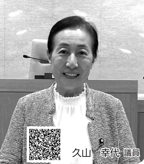
録画配信はこちら