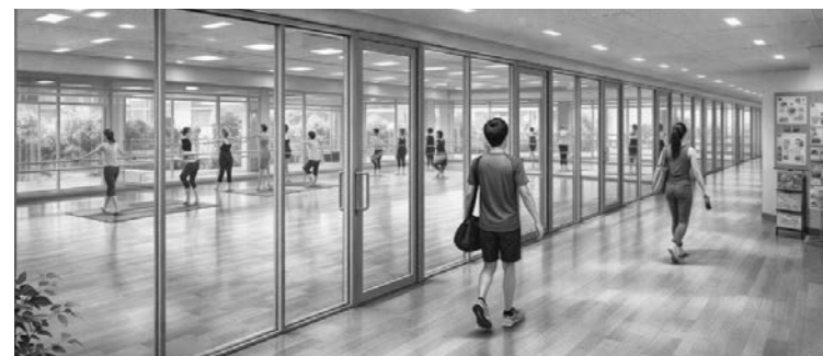
カルチャーセンター(イメージ)

カルチャーセンターの整備 老朽化している公共施設の有効活用の観点から、再利用し、住民が集えるカルチャーセンターとして整備することはできないか。