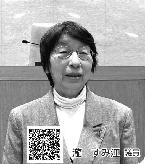
録画配信はこちら