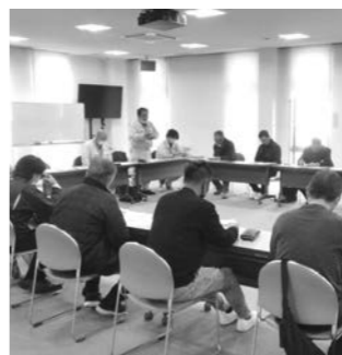
たつの市での視察研修

問 10年経って、中間管理機構を使つての再契約について、たつの市の考え方などを伺う。 答 (農林振興課) 再契約に係る業務は、兵庫県および滋賀県共に中間管理機構が行っており、再契約用の申請書を作成し、耕作者宛に申請書を送付するが、兵庫県では各市町が行うのに対して、滋賀県では中間管理機構が行っている。発送業務は異なるが、特に参考とするところはないと認識している。