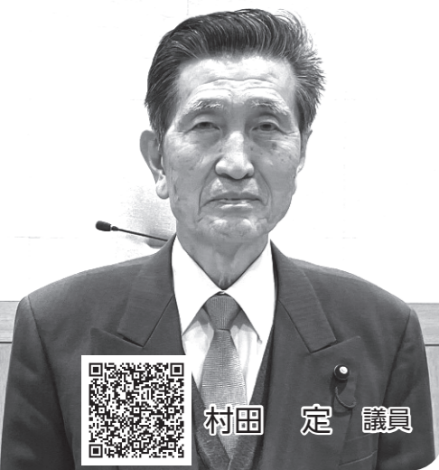
録画配信はこちら