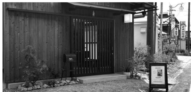
古民家を活用したお店

問 利活用の可能性がある空き家395戸のうち、空き家バンクに登録しているのはどれだけのか。