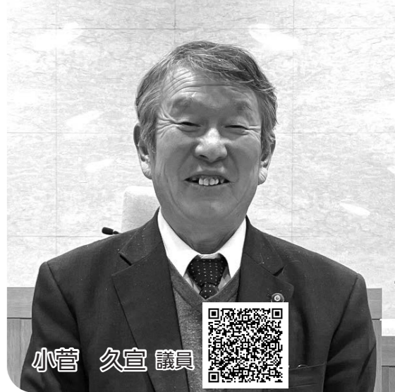
録画配信はこちら

8つの公共施設と4つの民間施設を、指定暑熱避難施設「クーリングシェルター」に指定しており、熱中症特別警戒アラートの発表期間中は休憩所として一般に開放されるが、飲料の提供は施設の利用者自身で準備いただくことが基本となっている。ドリンクングステーションを町で設置することは考えていない。 今後、クーリングシェルター指定施設に対して、平時からの施設開放を依頼していく予定である。