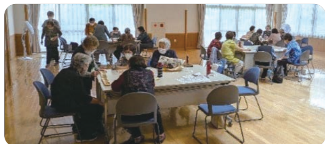
多世代を対象とした「つながる健康教室」「つながる居場所」の実施状況

A 「つながる健康教室」は週3回、午前10時から午前11時15分の間、いきいきセンターまたは愛の郷で運動を中心に実施している。「つながる居場所」は、週2回、午後1時から午後3時の間、いきいきセンターまたは愛の郷で脳トレ、趣味活動、月1回の外出支援を実施しており、町内の学校等との交流もある。