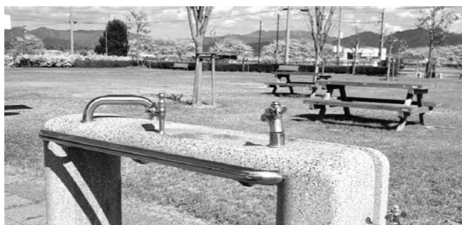
熱中症予防のため水分補給が重要

問 熱中症予防のためのドリンクングステーション(水飲栓やボトルディスプレイ等)の施設設置について伺う。 答 (町長) 当町の熱中症対策としては、役場庁舎や図書館などの