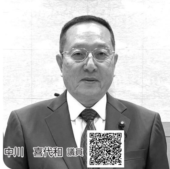
録画配信はこちら

問 障がい者の通院交通費補助等の考えは 答 (福祉政策監) 今日の物価高騰、特にガソリン価格の高騰の実態に見合っているのかという質問は、合併当初のタクシーの初乗り料金を基準とし本事業を継続していることから、調査研究する考えである。