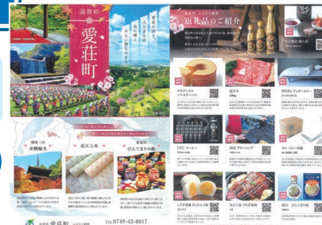
ふるさと納税チラシ

A 6つのポータルサイトで運営している。中間業者のノウハウを活用し、新たな製品の磨き上げや開発に注力する。