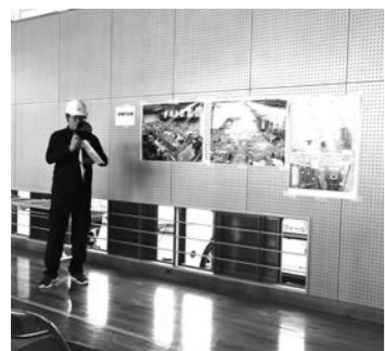
学校体育館で避難訓練

答 (町長) 町民の願い実現に向け、まずは義務教育である小学校と中学校の給食無償化を求める。