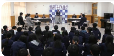
各学校での開催となったため、議員以外の皆さんも会場で議会の様子を見て、体感することができました。

答 これからも、住民のみなさんが自主的に美しい愛荘町を維持する取り組みを一緒にすすめていきたいと思います。