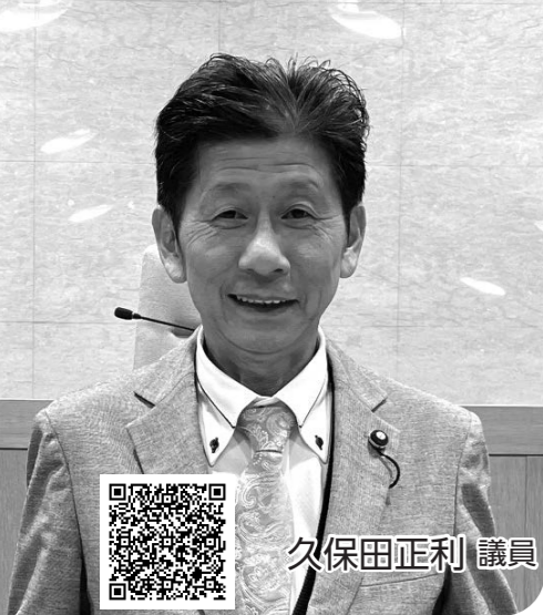
録画配信はこちら