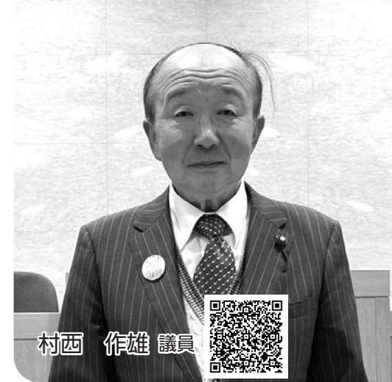
録画配信はこちら