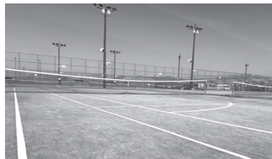
清掃されたテニスコート

問 公共施設マネジメント 答 (町長) 旧町時代から引継ぎ、維持してきた各施設は、人口減少の進行や利用ニーズの変容に直面する今、全て現行のまま維持することは、将来世代に多大な財政負担となる。そのため、施設の多機能化や複合化による行政運営の効率化を徹底し、そこで生み出された財源を、必要な住民サービスへ戦略的に振り向け持続可能なまちづくりにつなげる。