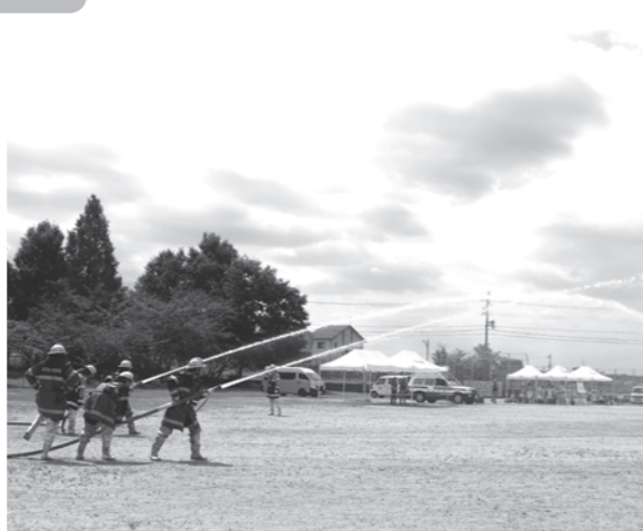
消防団訓練の様子