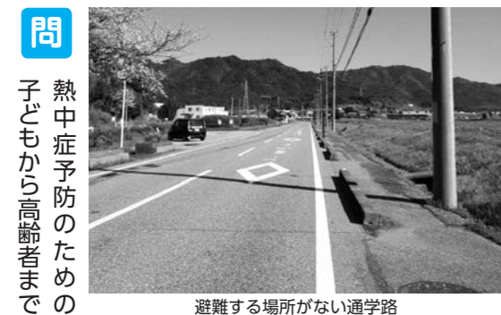
避難する場所がない通学路

問 公園やグラウンドゴルフ場に屋根のある休憩所など、野外で活動する子どもたちや高齢者の熱中症対策について伺う。 答 (農林振興課長) たつの市は、説明会を学区単位で実施され、地域計画の策定は地域が行い、本町と同様と考える。見直しに向けた取り組みを進めていく通知があり、関係機関と連携、モデル地区を定め地域の農業関係者や耕作者と、話し合いを始めている。町内全域の地域計画見直しに向けた取り組みを進める。