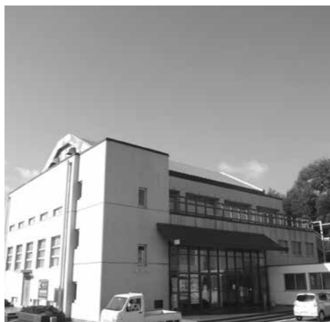
雨もれがする秦荘武道館

一般会計補正予算(第1号) 歳入歳出に834万3千円を追加し、総額を106億434万3千円とする。