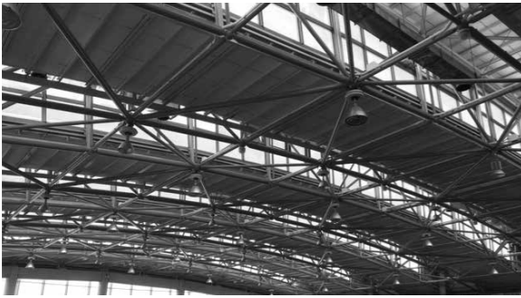
けんこうプールの天井修理

下水道・愛知川東面整備工事(変更) (理由) 国道8号長野北交差点付近から豊郷町方面にかけんこうプールの天井修理