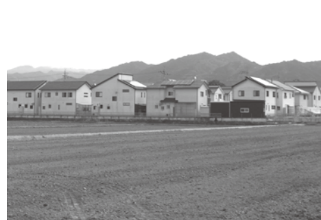
自治会未組織の団地

答 (町長) 副町長の選任は、速やかに 行う必要があると考えており、今定例会期中に議会の同意をお願いいたしたく、調整を進めている。