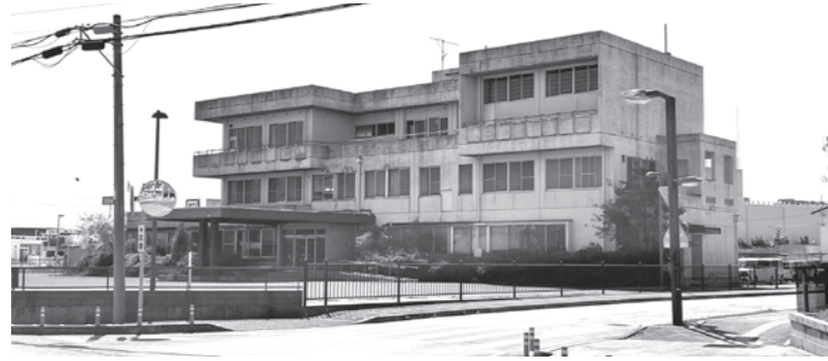
解体される旧愛知川警部交番