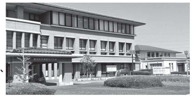
愛知川庁舎と保健センター

「修正案」の採決の結果、可否同数であったため、町議会委員会条例第14条の規定で、委員長の決するところにより、「議案第21号 令和5年度町一般会計予算に対する修正案」を可決した。また、「修正議決した部分を除く原案」の採決の結果、賛成多数で「修正部分を除く部分」は、原案のとおり可決した。