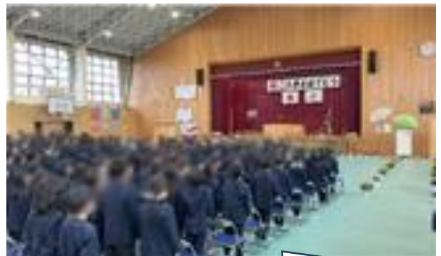
4月10日入学式・29名の1年生をお祝いしました。

※なお、本校の取組は、昨年度、読売テレビ「かんさい情報ネットten」の取材を受け、5月頃に放送予定です。詳細が分かり次第お知らせしますので、ぜひご覧ください。