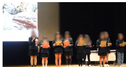
のびのびタイムとそれを参観して 学んでいる時の写真