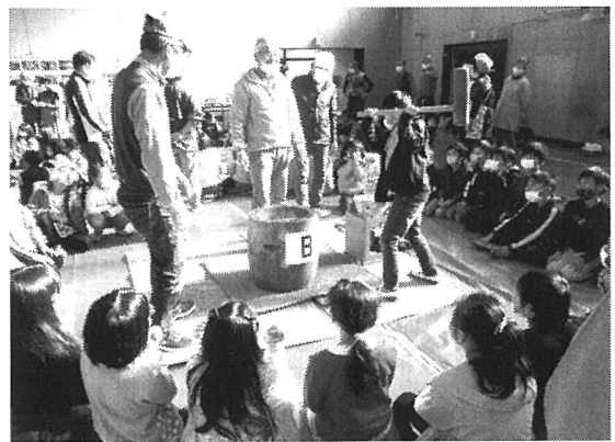
「ヨイショ！」のかけ声がそろう餅つき大会

各字の以文会役員（ボランティア）が訪問された際に、こうした趣旨にご賛同いただける方は、年会費（一家族あたり年間千円）の納入にご協力をお願いいたします。