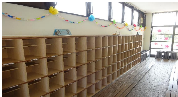
児童昇降口の下駄箱