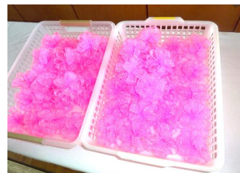
胸花（左胸につける）

3. 正面玄関を入るとクラスごとに受付があります。受付では、①「入学通知書」 ②「保健・緊急連絡カード」 ③「フッ化物洗口申込書」の3点を提出してください。お子様と保護者の方の靴は、下足置き場に置いてください。