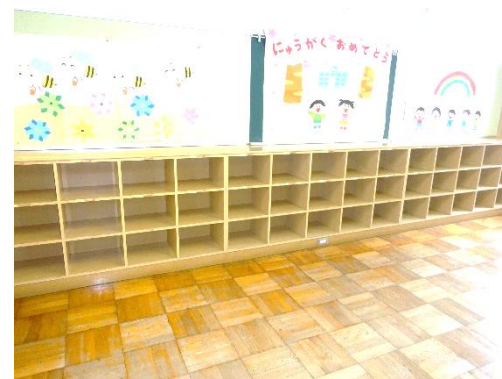
教室後ろのロッカー