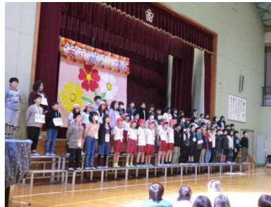
6年生の謎を見事に解明する4年生