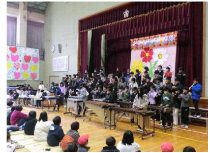
圧巻の合奏をする5年生