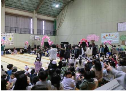
花道を通して笑顔で入場