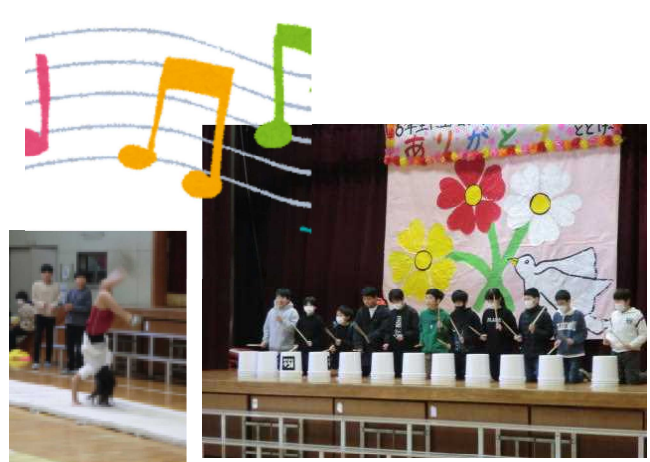
やっぱりかっこいい6年生！ あこがれの6年生！！