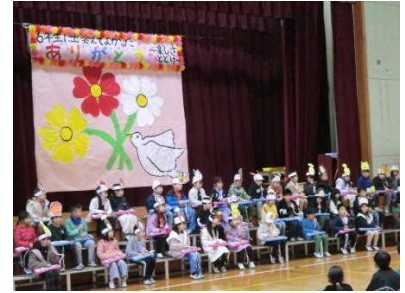
キラキラ1年生の大演奏