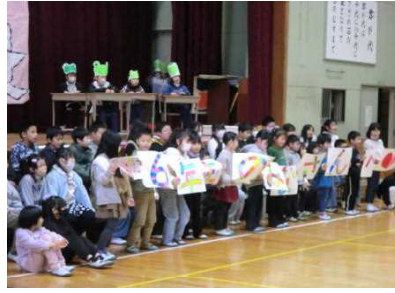
1番目の発表でドキドキ2年生