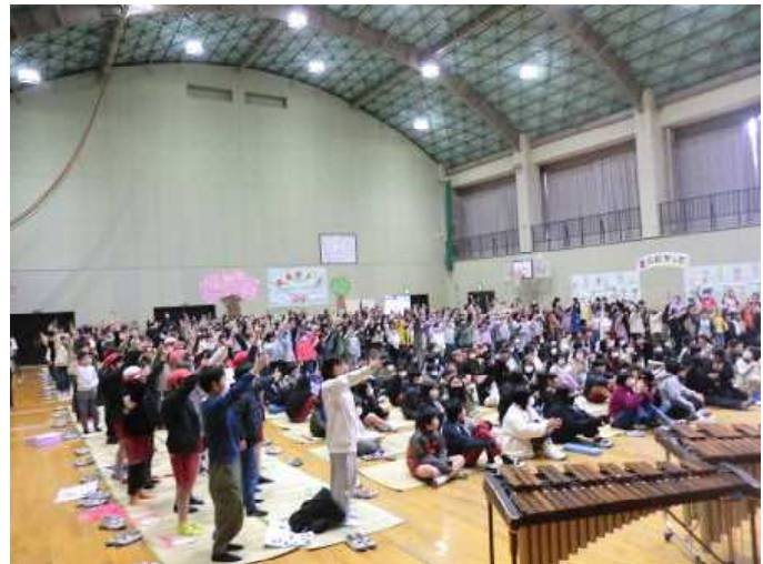
サプライズの全校ダンスで会場は大盛り上がり！