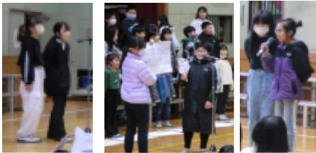
会の進行もパッチリ5年生