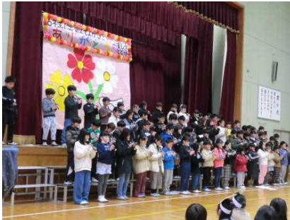
3年生の学習クイズでタイムスリップ