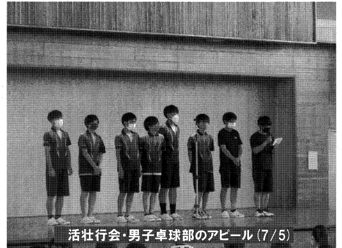
活壮行会・男子卓球部のアピール(7/5)

さて、いよいよ1学期も残すところあと1週間余となりました。この7月には、1学期の学習や生活の成果(学期末評価)を振り返ったり、部活動においても3年間の集大成となる各種大会を迎える時期でもあります。本人だけでなく大人にとっても、評価や結果が気になるころですが、その過程(途中経過の頑張り)についても是非注目していただき、これまでの「頑張れたこと」を振り返り、言葉で本人に伝えていきましょう。このことの積み重ねが、子どもの今後の頑張りエネルギー