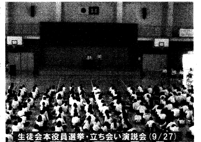
生徒会本役員選挙・立ち会い演説会(9/27)

先月はじめに開催しました体育大会では、多くの保護者の皆様の参観をいただき誠にありがとうございました。今年の体育大会は、4年ぶりに感染症予防のための制約のない、伸び伸びとできる大会となりました。当日は天候にも恵まれ、生徒会や各団のリーダーとなる3年生の働きもあり、全校生徒が“爽やかにやりきった”1日となりました。