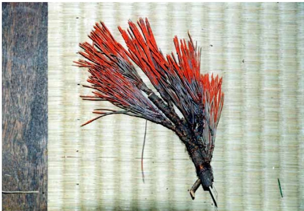
図4 イロカイ（膠で着色したもの）