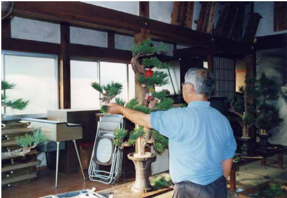
図 3 カイをつける