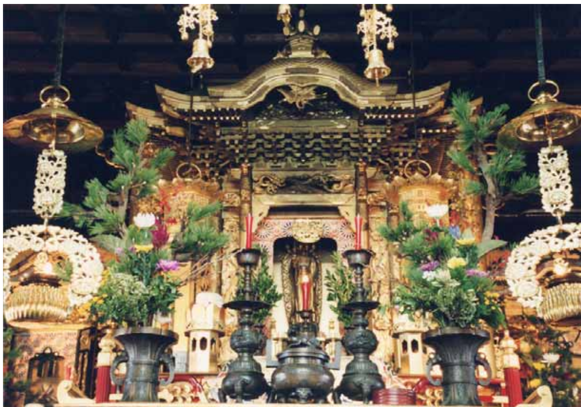
図1 報恩講の仏花（大乘寺）